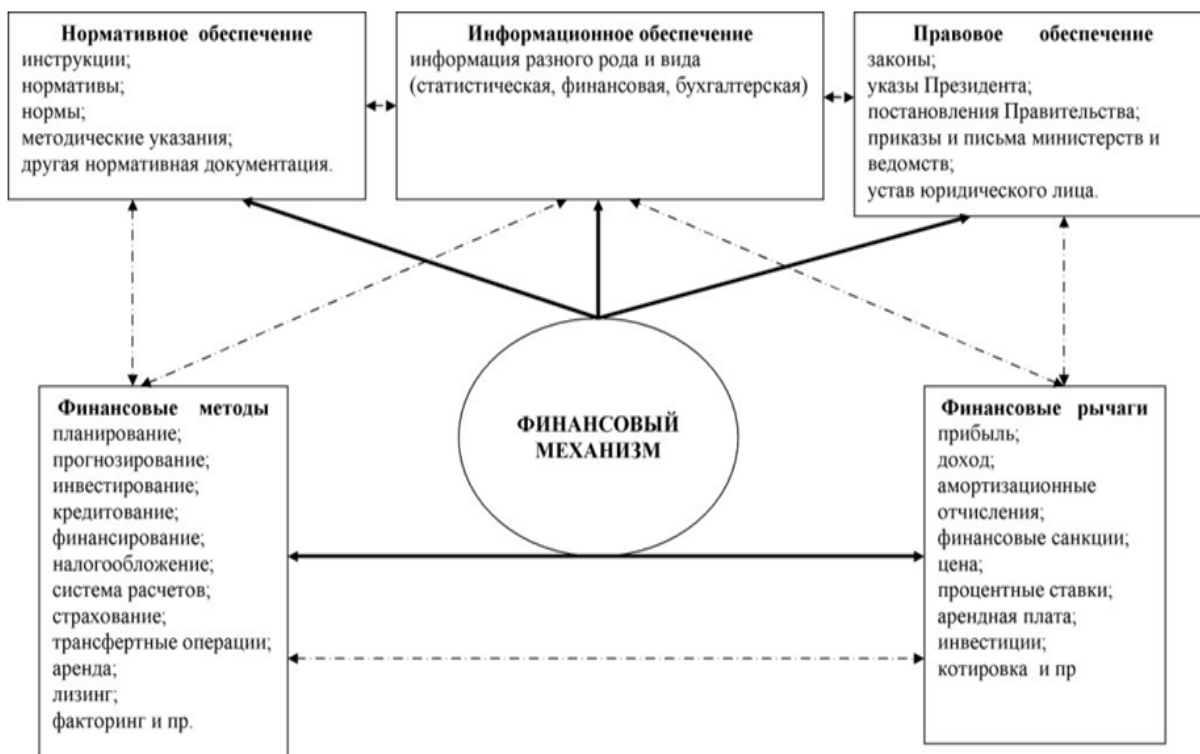
Рисунок 1 - Элементы финансового механизма [2, с.13]

В хозяйственном и финансовом механизмах пользуются финансово-экономическими нормативами и лимитами. Нормативы – расчетно обоснованные величины затрат или распределения ресурсов, лимиты – предельные размеры использования ресурсов, используются в финансовом планировании (Рисунок 1).