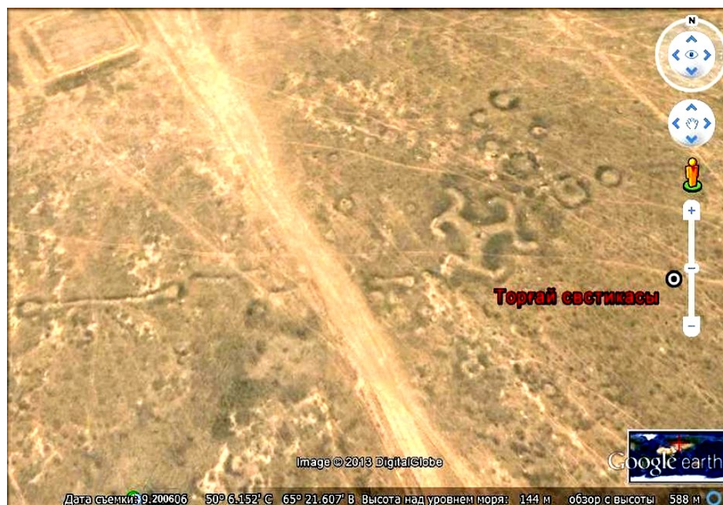
Рисунок 2 - Тургайская свастика

составляет 94 метра, а средняя высота -около 70 сантиметров. Свастика остается одним из древнейших символов в истории человечества и может иметь несколько символических значений – жизнь, движение, свет, солнце, благополучие. Свастику часто можно увидеть в буддийских храмах, где она придерживается идеи совершенства. Первый из таких символов появился в позднем палеолите.