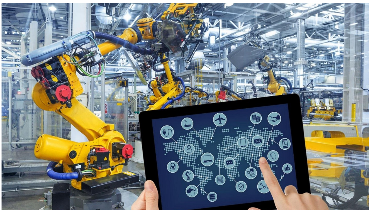
Фото 1 – Цифровизация промышленного предприятия

Новая цифровая революция изменяет сегодняшние способы производства, цепочки поставок и цепочки создания добавленной стоимости. Индустрия 4.0, один из драйверов цифровой трансформации промышленности, представляет собой концепцию организации производства, где дополнительная ценность обеспечивается за счет интеграции физических объектов, процессов и цифровых технологий, при которой в режиме реального времени осуществляется мониторинг физических процессов, принимаются децентрализованные решения, а также происходит взаимодействие машин между собой и людьми. Сквозная цифровизация всех физических активов и их интеграция создают основу для перехода от массового производства к массовой индивидуализации, повышается гибкость производства, сокращается время освоения новой продукции, что позволяет реализовывать новые бизнес-модели и применять индивидуализированный подход работы с клиентами. Все это в значительной степени повышает эффективность и конкурентоспособность предприятий промышленности ( фото 1).