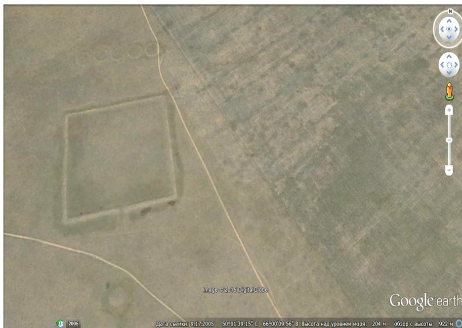
Рисунок 3 - Шилийский квадрат

В дневнике пишет: «отправляясь в наш путь, прибыли мы к некому старому городищу, с простертыми валами и рвами укрепленному. Город сей сделал на подобие четырехугольного замка, имея во все стороны равное пространство валов. С восточной стороны видимы там земляные ворота, открывающие свободный путь внутри восьми укреплений. Упавшие валы и рвы, лежавшие глубоко в своей лишенной, свидетельствуют о древностях настоящего места: но применение достойных развалний ни внутри, ни в валах не видно, кроме черепицы и камня, валяющегося во градских местах» [6]. Детально изучив маршрут экспедиции, Дмитрий Дей отмечает, что описание населенного пункта соответствует местоположению и описанию объекта «Шилийский квадрат».