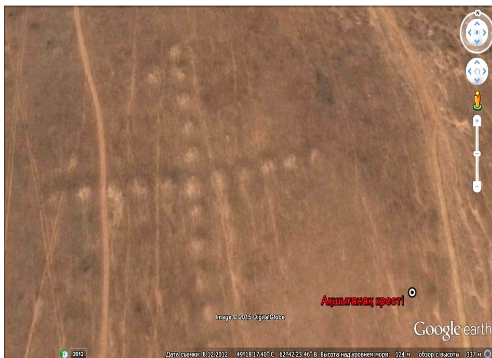
Рисунок 4 - Акшыганакский крест