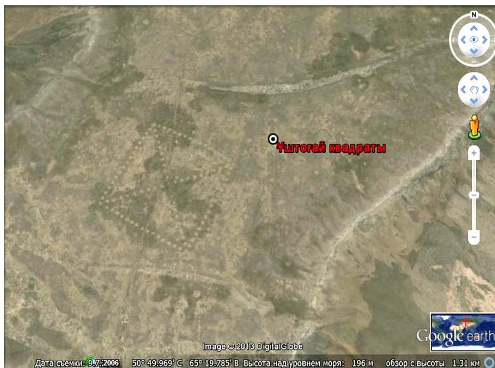
Рисунок 1 - Уштогайский квадрат

1010 квадратных метров. Длина одной стены квадрата-287 м, диагональ-400 м. Тогда общая длина стен и диагоналей квадрата будет равна 1948 м, то есть 2 км. Видно, что всемирно известный квадрат Хеопса намного превышает длину стен (230 м) [3].