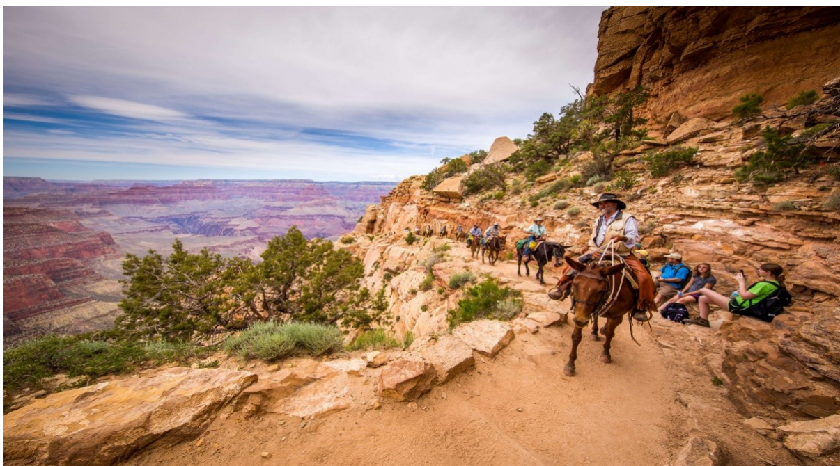
Пешие тропы Гранд Каньона / Фото с сайта shutterstock.com

С недавних пор на территории каньона по всей территории стоят специальные "водопойные станции", где можно бесплатно набрать воды. Американцы посчитали, что 20% отходов парка составляет пластик, и решили это исправить. Однако переживать не нужно, путешественник всегда сможет утолить жажду: