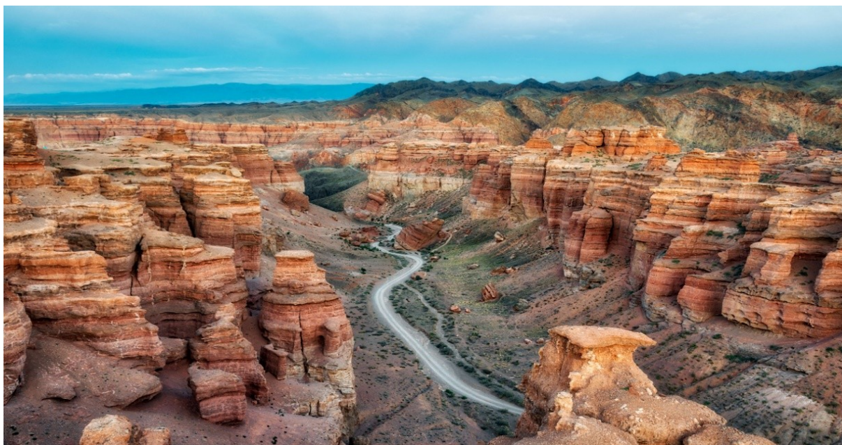
Чарынский каньон

Что же ждёт туриста в Чарынском каньоне, кроме природы?