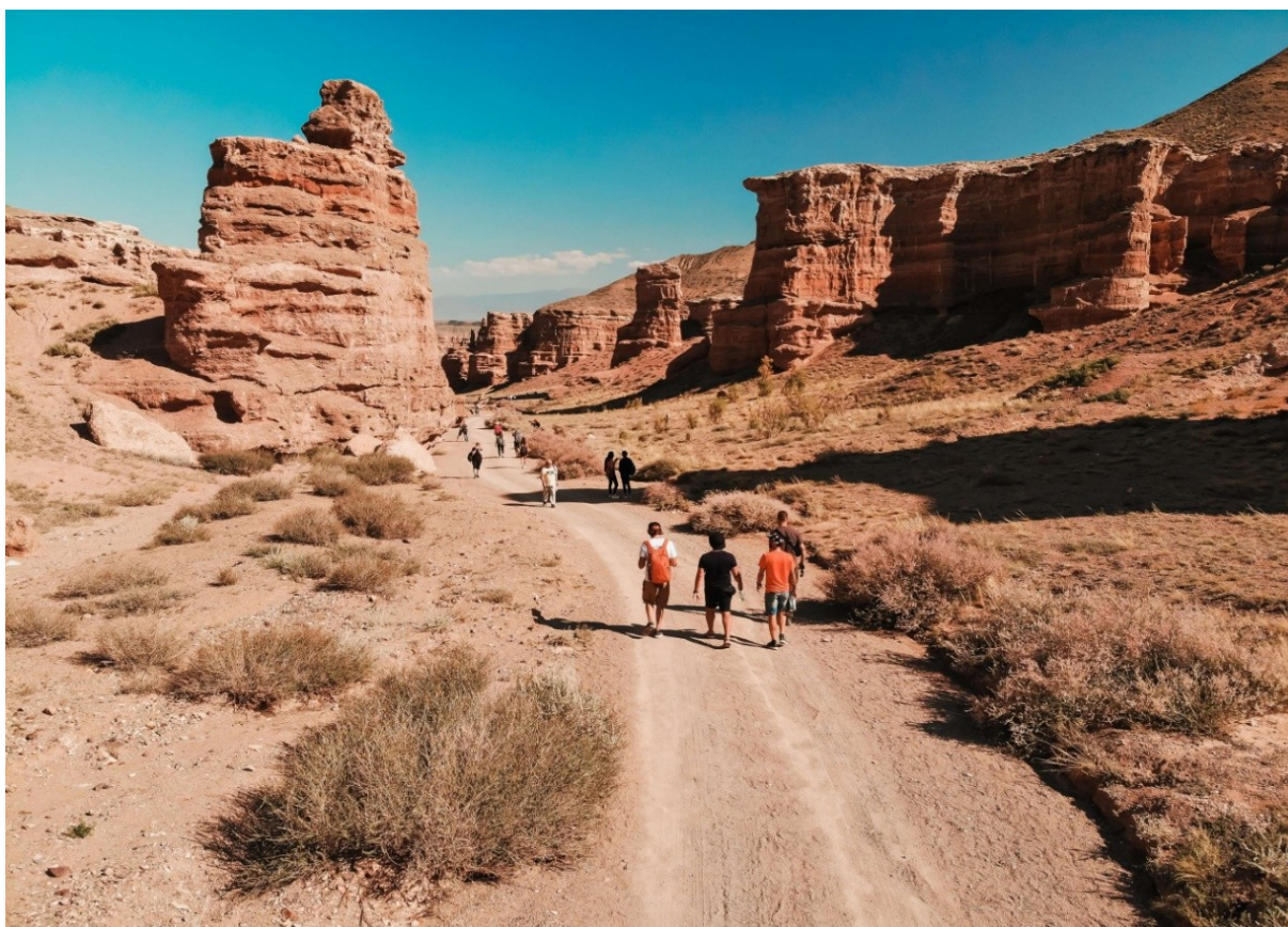
Чарынский каньон

только в экопарке, а потому советуют запасаться заранее и подготовиться к отсутствию комфорта. Все удобства либо на парковке, либо уже в экопарке [3].