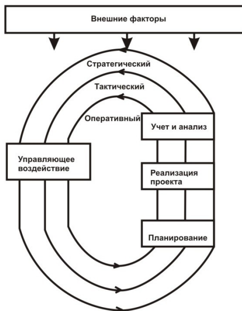
Рисунок 1 - Схема адаптивной модели управления

В следующих разделах приводятся конкретные механизмы адаптации, используемые на различных этапах реализации модели.