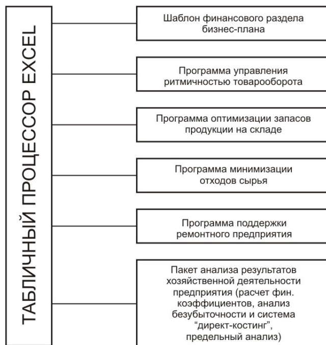
Рисунок 2 Схема компьютерной поддержки управления малым предприятием

Любое мероприятие, требующее вложения средств, должно начинаться с разработки внутрифирменного документа, называемого бизнес-планом.