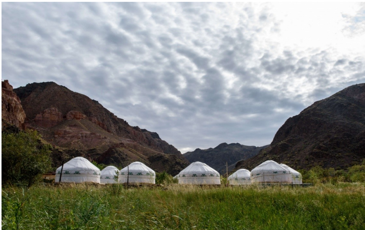
Эко парк в Чарынском Каньоне

Однако в отзывах после посещения Чарынского каньона чаще всего встречаются такие: "Не хватает хотя бы минимального сервиса". В "отзовиках" путешественники жалуются на проблемы с водой, её можно купить