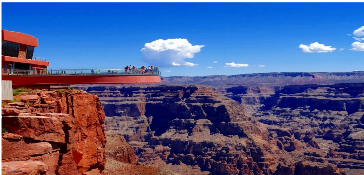
Гранд Каньон в США

Туристам здесь предлагают жильё (от велосипедов, душ, прачечную, места для пикника до отелей), пункты питания (от маленьких закусочных до ресторанов), магазины ты. (не только сувенирные), почту, банк, прокат