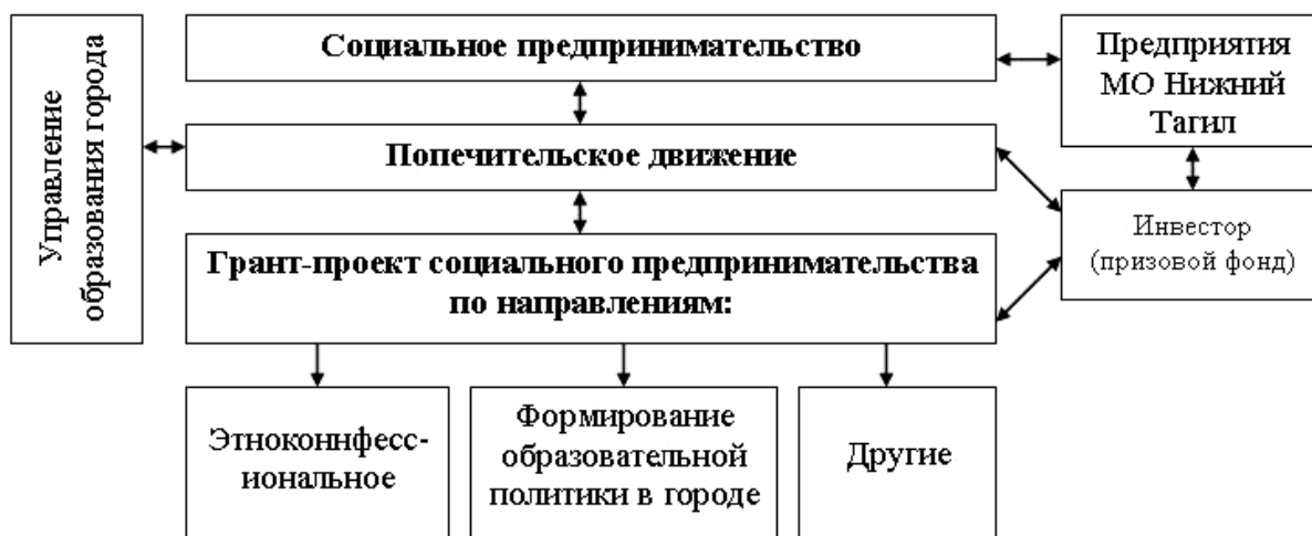
Рисунок 1 – Механизм формирования социального предпринимательства в образовании МО Нижний Тагил

Таким образом, отсутствие такого гражданского института в образовании автоматически превращает образование в узковедомственное бесправное учреждение.